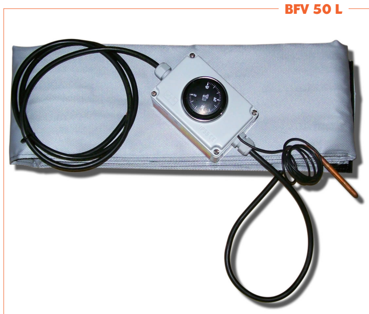
BFV 50 L

BFV1005150300: Manta calefactora para tambores y bidones de 50 litros